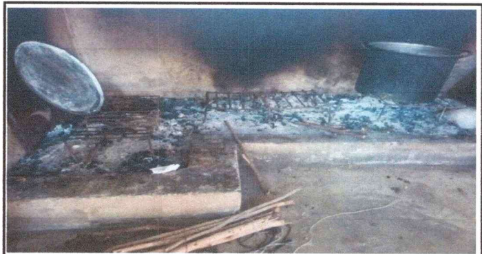
Foto 4: Sustitucion de estufa rural que incluye chimenea y plancha de metal.