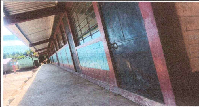
Foto 1: Módulo 1: Puerta de Dirección en mal estado, paredes con pintura descolorida y aulas sin balcones.